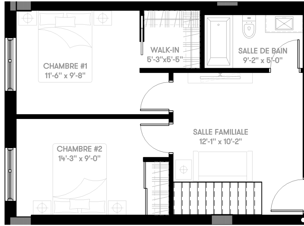
UNITÉ NIVEAU 2