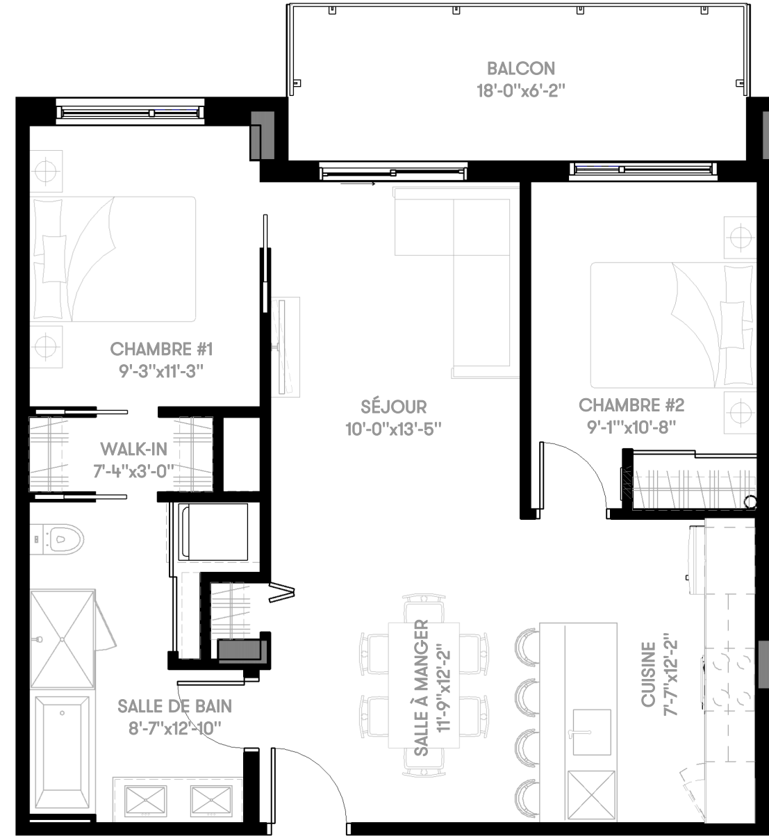
UNITÉ TYPE RDC